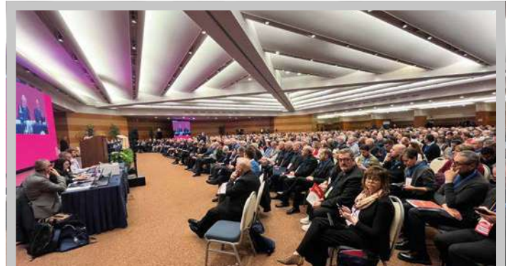
I delegati della III Assemblea sinodale delle chiese in Italia

Il Documento è il punto di arrivo di un lungo cammino di ascolto e discernimento iniziato nel 2021. Il Cammino Sinodale italiano si è intrecciato con il Sinodo universale in questi anni e in questi anni ha saputo generare dialogo, processi, riflessioni e proposte che confluiscono in questo Documento di Sintesi. La Terza Assemblea Sinodale dello scorso 25 ottobre ha segnato la conclusione di questo cammino e ha riconsegnato ai vescovi il frutto di questo discernimento finalizzato ad animare la forza missionaria e sinodale delle nostre comunità; è il frutto dello Spirito Santo che in questi anni ha parlato alla sua Chiesa e le indica la strada da seguire per il prossimo futuro. I più di 800 delegati (vescovi, preti e laici) hanno votato ogni singola proposta, e anche quelle con un maggiore numero di voti sfavorevoli hanno ottenuto almeno il 77% dei voti favorevoli, ben al di sopra dei due terzi con i quali abitualmente viene misurato il consenso ecclesiale: questo documento rappresenta veramente una parola comune espressa dal popolo di Dio che è in Italia.