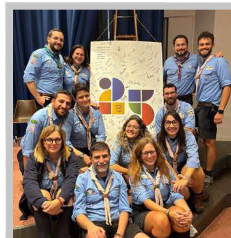
I laboratori pomeridiani

Venticinque anni di storia, di impegno e di servizio non sono per noi solo un anniversario da celebrare, ma un richiamo a continuare a camminare insieme, custodendo e rafforzando i legami che rendono la nostra comunità viva, educativa e cristiana, con-