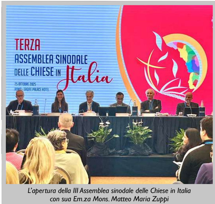
L'apertura della III Assemblea sinodale delle Chiese in Italia con sua Em.za Mons. Matteo Maria Zuppi

unioni omoaffettive, ecc.), la formazione dei formatori, i percorsi di iniziazione cristiana. Significativo che molti di questi argomenti siano emersi anche a livello internazionale, nella restituzione in Aula Paolo VI dai delegati sinodali continentali a Papa Leone XIV in occasione del Giubileo delle équipes sinodali e degli organismi di partecipazione: ascolto, comunione e missione le tre parole chiavi della sinodalità per il papa. “La Chiesa deve far sentire la propria voce, anzi deve alzarla per cambiare il mondo e renderlo migliore” ha sottolineato Prevost, stilando una sorta di agenda per la comunità ecclesiale universale: raggiungere giovani e famiglie affinché tutti siano strumenti di pace, non rimanere passivi di fronte alle sfide della custodia del creato, testimoniare carità e amore fraterno, perdono e riconciliazione in un momento segnato da guerre e violenze, eliminare le discriminazioni in modo che ogni persona sia realmente rispettata e valorizzata. “Regola suprema, nella Chiesa, è l’amore: nessuno è chiamato a comandare, tutti sono chiamati