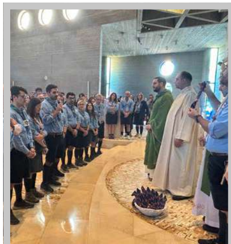
Un momento della celebrazione eucaristica nella Parrocchia di S. Anna a Monopoli

In questi 25 anni, la Zona Bari Sud ha accompagnato generazioni di ragazzi e capi in un percorso educativo e cristiano che ha trasformato la promessa scout in gesti concreti di servizio, testimonianza e autenticità. Il progetto di Zona “Non ci ardeva forse il cuore?” , che ci ha guidato negli ultimi tre anni nello sperare, nell'incontrare e nel riconoscere, ci ha reso consapevoli che ciascuno ha preso parte a questo cammino condiviso, realizzandolo ogni giorno