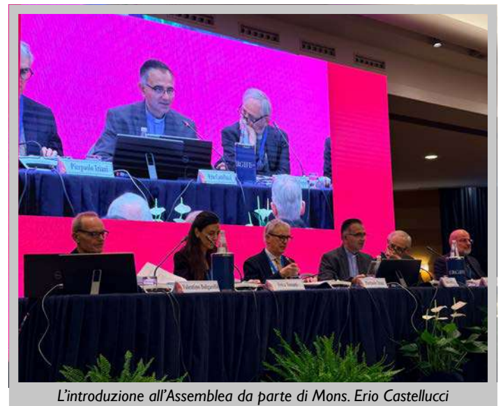
L'introduzione all'Assemblea da parte di Mons. Erio Castellucci

a servire; nessuno deve imporre le proprie idee, tutti dobbiamo reciprocamente ascoltarci; nessuno è escluso, tutti siamo chiamati a partecipare; nessuno possiede la verità tutta intera, tutti dobbiamo umilmente cercarla, e cercarla insieme – ha sottolineato Papa Leone nell’omelia domenicale - Essere Chiesa sinodale significa riconoscere che la verità non si possiede, ma si cerca insieme, lasciandosi guidare da un cuore inquieto e innamorato dell’Amore. Carissimi, dobbiamo sognare e costruire una Chiesa umile. (...) Impegniamoci a costruire una Chiesa tutta sinodale, tutta ministeriale, tutta attratta da Cristo e perciò protesa al servizio del mondo”. Il documento approvato è ora affidato alle cure dei vescovi italiani, che si riuniranno ad Assisi per l’assemblea generale e che provvederanno a stilare i passi della fase attuativa.