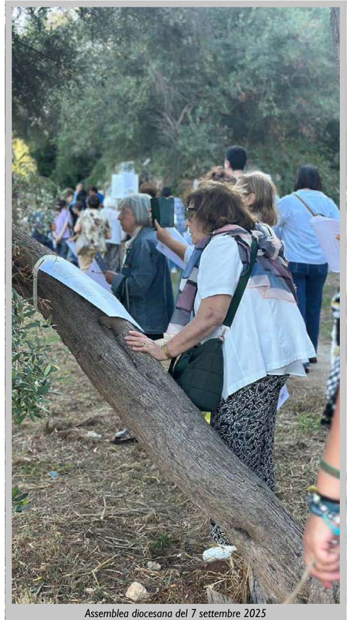
Assemblea diocesana del 7 settembre 2025

Quest'anno, inoltre, la Chiesa intera guarda con gioia alla canonizzazione del beato Pier Giorgio Frassati , giovane di Azione Cattolica che ha vissuto la fede nella semplicità del quotidiano, nel servizio ai poveri e nella condivisione fraterna. La sua testimonianza, segnata da un sorriso luminoso e da una fede concreta, diventa per tutti un richiamo a vivere il Vangelo “verso l'alto”, con i piedi ben piantati nella vita di ogni giorno.